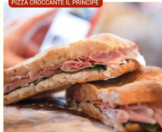
PIZZA CROCCANTE IL PRINCIPE

In unserer Pizza-Favoritenliste haben wir dieser Variante schon mal einen Spitzenplatz eingeräumt.