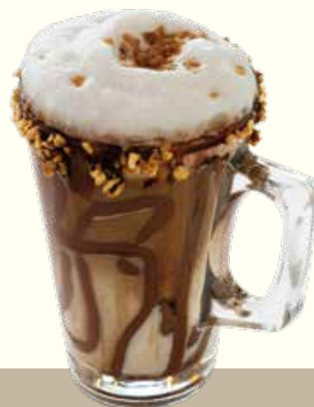
Caffè alla Nocciola