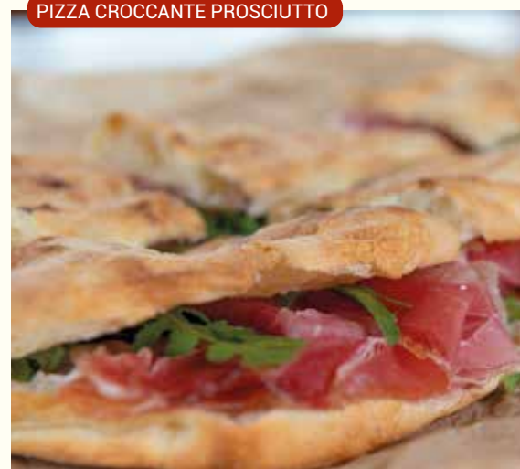
PIZZA CROCCANTE PROSCIUTTO