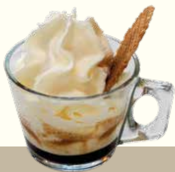
Espresso con panna