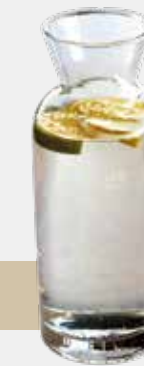
Zitrone / Limette