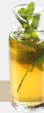
Holunder / Melisse