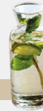
Ingwer / Limette / Minze