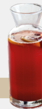
Himbeere / Zitrone